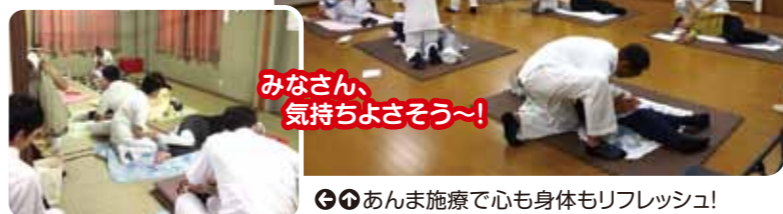
◎あんま施療で心も身体もリフレッシュ!

9月24日、新庄地域、菅原地域、淡路地域において、大阪市立視覚特別支援学校と当会との共催で、あんま施療を実施しました。毎年、ご好評をいただいているこのあんま施療、今回も、どの地域も満員御礼の大盛況でした。参加者からは「気持ち良かった!身体もほぐれて心も軽くなったわ。また来てほしい」と喜びの声があがりました。