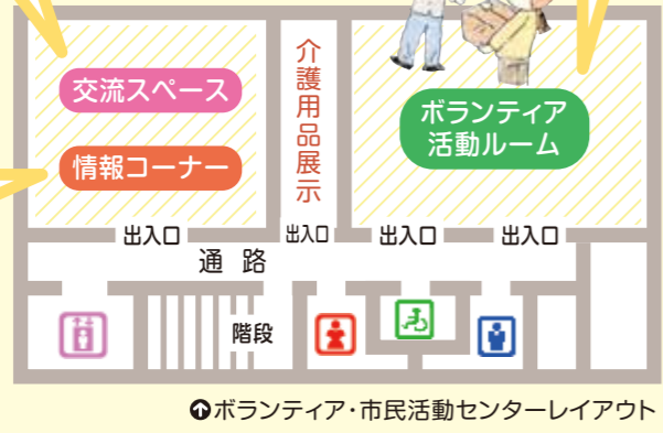
ボランティア・市民活動センターレイアウト

お問合せ…東淀川区ボランティア・市民活動センター ほぼえみ3階 TEL.6370-1630 月~土曜 9:30~17:00(日・祝、年末年始を除く)