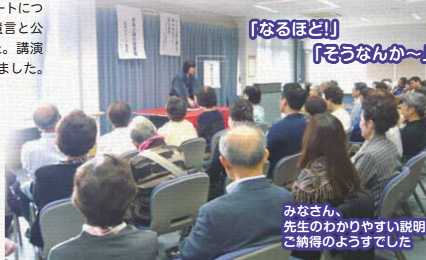
「なるほど!!」「そうなんか~」

●参加者には、当センターがエンディングノートとして作成した「もしものときにそなえて~あんしんシート~」を配付しました。リング付なので、目に見えるところに置いていただき、ご家族等にもエンディングノートを共有していただければと考えています。介護を受けても人生の最期まで自分らしく生きるために、まずは笑顔でいること、そして自分の人生と向き合うことの大切さを学ぶ貴重な機会となりました。