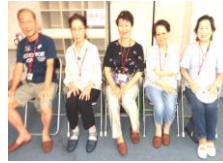
赤チーム優勝 おめでとう！