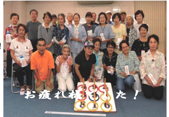
わなげ大会参加者のみなさん