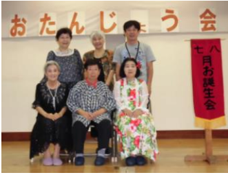
7月生まれのお誕生者