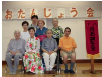
8月生まれのお誕生者