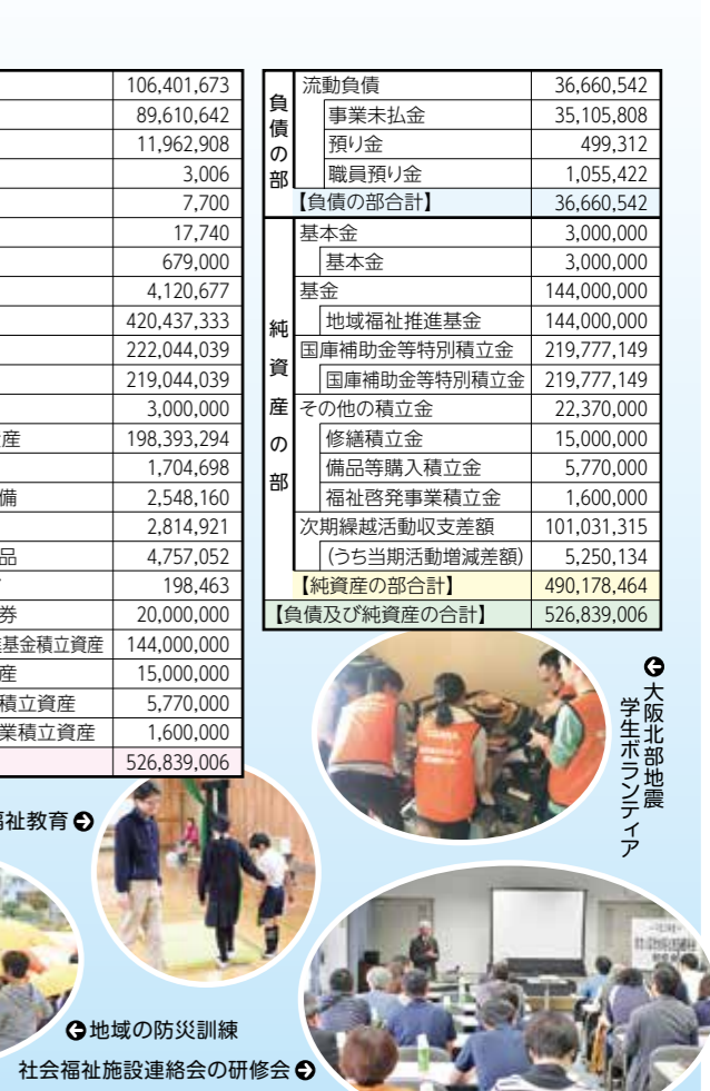
大阪北部地震 学生ボランティア

相談日は、祝休日・年末年始等を除きます。また予告なく変更する場合があります。(2019年8月現在)