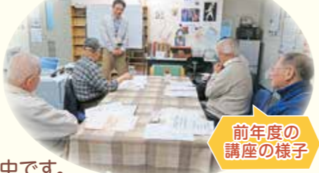
前年度の講座の様子

日時 9月5日～10月17日の毎週木曜日 10:30～12:00 全7回 場所 区在宅サービスセンター ほほえみ4階「ほほえみサロン」