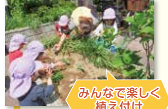
みんな楽しく植え付け

高齢者の方が、慣れない手つきの子どもたちにやさしく手を添えて植え付けをしました。「かわいいお花ね」「大きくなるのが楽しみ!」と会話も弾みました。地域のボランティアと子どもたちが、秋のサツマイモの収穫を楽しみに頑張ってます。