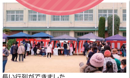
長い行列ができました

女性部の災害時の炊き出し訓練を兼ねた豚汁には長い行列が出来、子どもたちも重い杵をよいしょと持ち上げ、お餅つきを頑張ってくれました。きな粉や大根おろし、ぜんざいを美味しそうに食べる姿に、やはり人と人が会って一緒に食事をしたり笑ったり、行事を行うという事の大切さを再認識したフェスティバルでした。