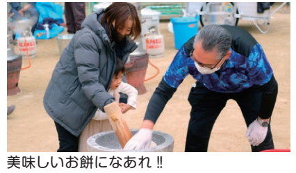
美味しいお餅になあれ!!