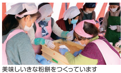
美味しいきな粉餅をつくっています