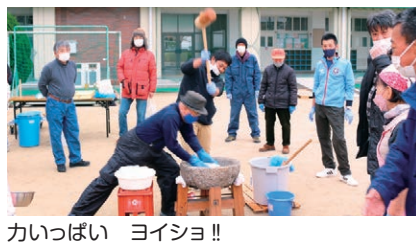
かいっぱい ヨイショ!!

豊里南は、やると決めたら地域全員が応援してくれる地域です。「出来るか出来ひんか」ではなく「やるかやらんか」です。やると決めた3年ぶりの豊里南ウインターフェスティバル(餅つき大会)が12月4日(日)に豊里南小学校校庭で開催されました。コロナの感染対策をしながらボランティア、スタッフの皆さんの努力で無事に成功を収める事が出来ました。