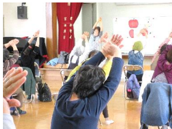
4月5日(水) すこやかマッサージ&ダンス♪