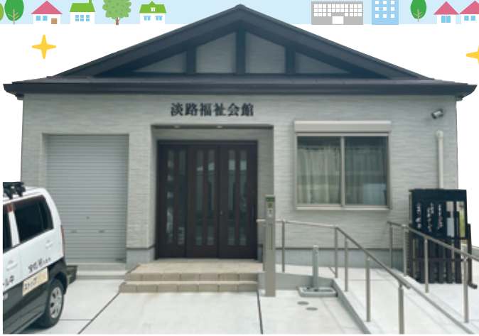
平屋建てバリアフリーの、新しい淡路福祉会館ができました。(淡路5-4-12)

これまで使用していた福祉会館が老朽化し、新たな福祉会館の建設を求め続けた結果、淡路地域の集いの場である淡路福祉会館が新築され令和5年3月25日に落成式を行いました。旧福祉会館で行っていたふれあい喫茶や食事サービス、淡路中学校で行っていた子育てサロンなどの活動も、4月から新福祉会館で実施しています。ふれあい喫茶では、新しいキッチンになった事により、メニューにモーニングセットが新たに加わりました。食事サービスの参加者からは、「今までは階段を上ったり下りたりが大変だったけど、新しい会館は平屋建てのバリアフリーになり、参加しやすくなった」との声があがっています。子育てサロンは、月に1回プログラムを変更しながら実施しています。