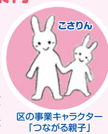
区の事業キャラクター「つながる親子」

利用支援専門員が、保育所・幼稚園などの入所相談、子育て支援制度・施設や機関の案内など家庭にあった支援を受けられるように情報提供や相談・援助をおこないます。また、地域の子育てサロン、子ども・子育てプラザ、区役所乳幼児健診会場でも相談をお受けしています。(予約優先)