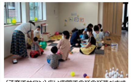
【子育てサロン】広い空間でのびのび遊べます。3歳までのお子さんを対象としています。