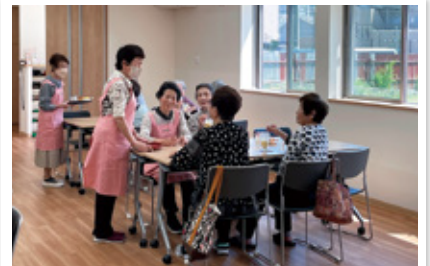
【ふれあい喫茶】どなたでもご参加いただけます。

これまで使用していた福祉会館が老朽化し、新たな福祉会館の建設を求め続けた結果、淡路地域の集いの場である淡路福祉会館が新築され令和5年3月25日に落成式を行いました。旧福祉会館で行っていたふれあい喫茶や食事サービス、淡路中学校で行っていた子育てサロンなどの活動も、4月から新福祉会館で実施しています。ふれあい喫茶では、新しいキッチンになった事により、メニューにモーニングセットが新たに加わりました。食事サービスの参加者からは、「今までは階段を上ったり下りたりが大変だったけど、新しい会館は平屋建てのバリアフリーになり、参加しやすくなった」との声があがっています。子育てサロンは、月に1回プログラムを変更しながら実施しています。