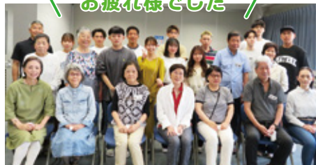
講座終了後にはスマホサポーターと学生さんと集合写真