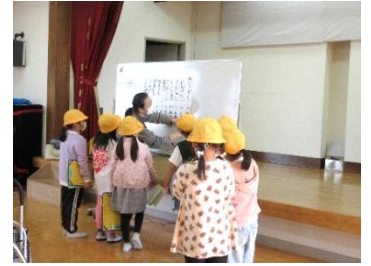
ありがとう♪また来てね😊