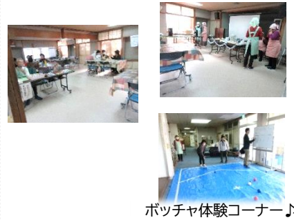
ポッチャ体験コーナー♪